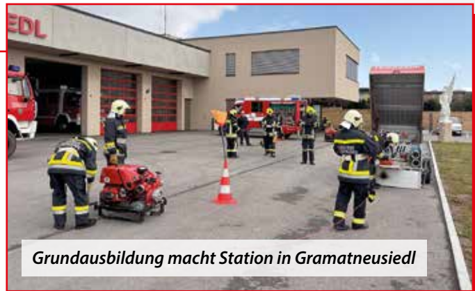
Grundausbildung macht Station in Gramatneusiedl

Weitere Einsätze auf Grund von Gasgeruch und zur Unterstützung der Nachbarfeuerwehren in Ebergassing und Mitterndorf kamen noch dazu.