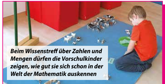
Beim Wissenstreff über Zahlen und Mengen dürfen die Vorschulkinder zeigen, wie gut sie sich schon in der Welt der Mathematik auskennen