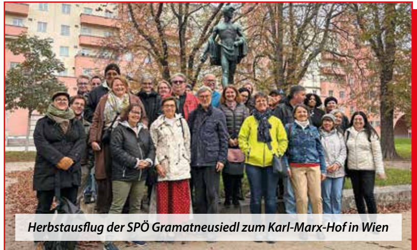
Herbstausflug der SPÖ Gramatneusiedl zum Karl-Marx-Hof in Wien

Anschließend luden wir alle Teilnehmer:innen unseres Ausflugs zum Mittagessen ein, wo weiter über unseren interessanten Besuch des Karl-Marx-Hofes diskutiert wurde und unser Vormittag in Wien gemütlich ausklang.