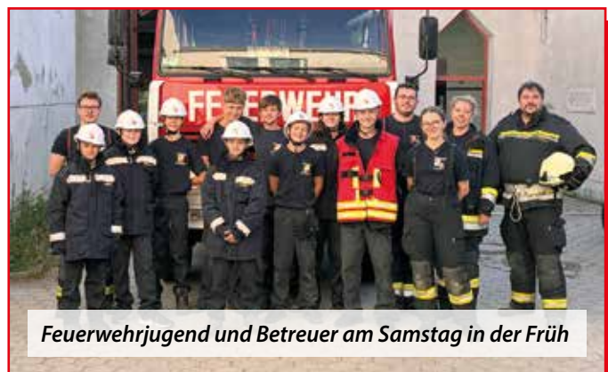
Feuerwehrjugend und Betreuer am Samstag in der Früh

Natürlich wurde zwischen den Einsätzen und Ausflügen gekocht, gegessen und gespielt.