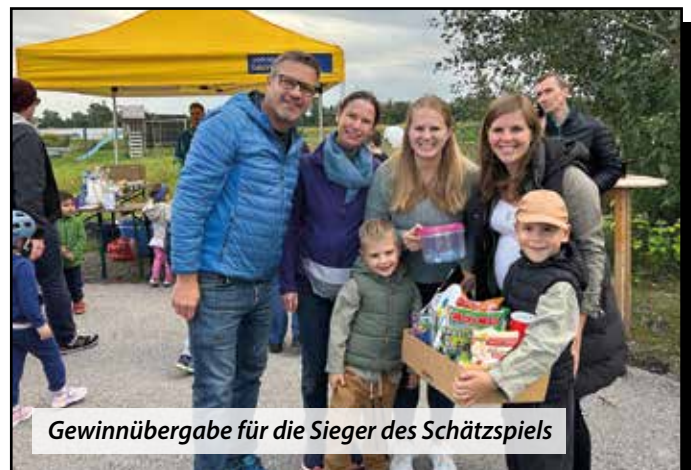
Gewinnübergabe für die Sieger des Schätzspiels