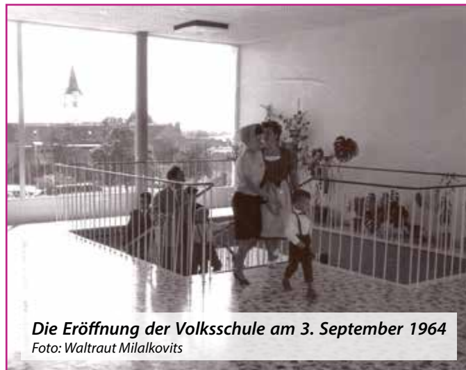
Die Eröffnung der Volksschule am 3. September 1964

Die Topothek ist dafür das geeignete Werkzeug.