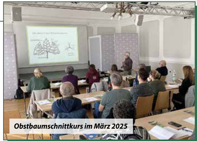
Obstbaumschnittkurs im März 2025

Seit einigen Jahren veranstalten die Österreichischen Baumfreunde Obstbaumschnittkurse in verschiedenen Gemeinden. Auch im nächsten Frühjahr werden wir wieder Kurse organisieren. Zum ersten Mal wird auch ein Veredlungskurs angeboten.