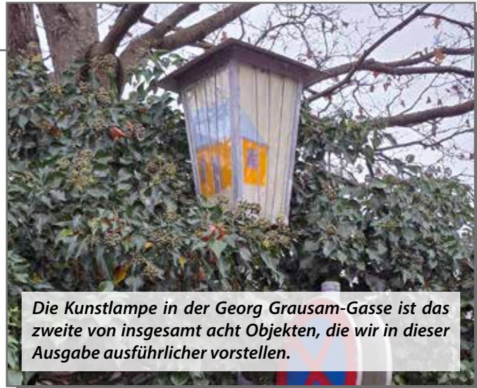
Die Kunstlampe in der Georg Grausam-Gasse ist das zweite von insgesamt acht Objekten, die wir in dieser Ausgabe ausführlicher vorstellen.