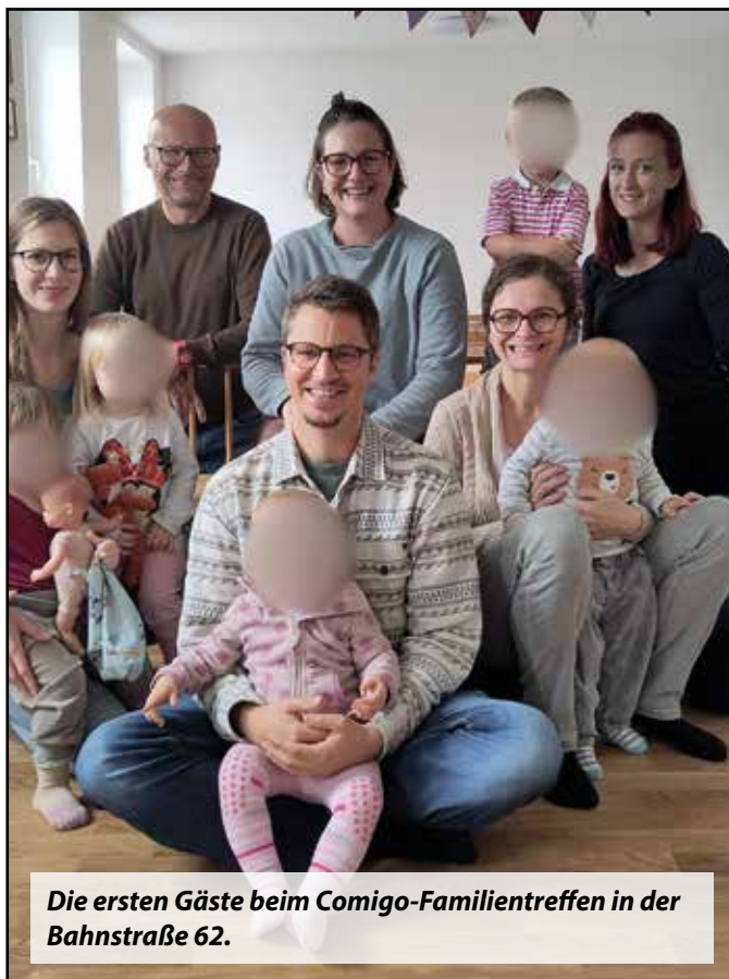
Die ersten Gäste beim Comigo-Familientreffen in der Bahnstraße 62.