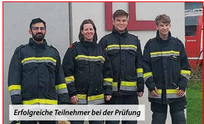
Erfolgreiche Teilnehmer bei der Prüfung