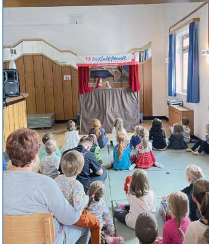
Der Kasperl am Kinderflohmarkt