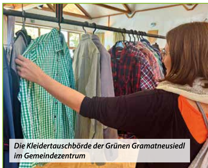
Die Kleidertauschbörde der Grünen Gramatneusiedl im Gemeindezentrum