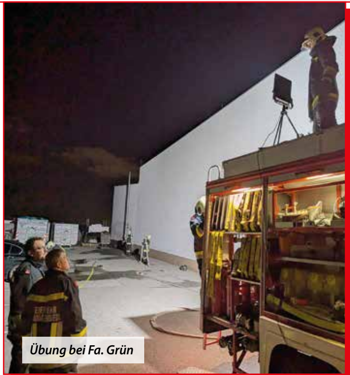
Übung bei Fa. Grün

Natürlich wurde in den letzten Monaten auch fleißig geübt. So stand eine Übung zum Thema Wasserförderung über längere Strecken am Programm. Dabei ging es darum die Löschmannschaften bei einem abgelegenen Brandherd mit Löschwasser zu versorgen. Weiters wurde ein Stationsbetrieb zum Thema Türöffnung und technischer Einsatz abgehalten. Ende Oktober durften wir bei der Fa. Grün im Gewerbegebiet eine Übung und eine Begehung abhalten. Dabei ging es einerseits darum einen Löschangriff im Außenbereich durchzuführen und dabei das nebenstehende Gebäude vor einem Übergriff der Flammen zu schützen. Andererseits konnten wir uns bei der Begehung ein Bild von möglichen Gefahrenquellen im Betrieb machen.