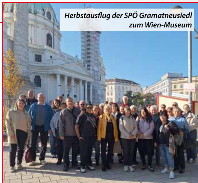
Herbstausflug der SPÖ Gramatneusiedl zum Wien-Museum

Mitte Oktober organisierten wir unseren Herbstausflug ins sehr interessante Wien-Museum. Aufgeteilt in zwei Gruppen lernten wir im Rahmen einer Führung viel Neues über die Entstehung und die Geschichte von Wien. Selbstverständlich blieb genug Zeit, um die Ausstellung selbst zu erkunden. Anschließend lud die SPÖ Gramatneusiedl zum Mittagessen ins Restaurant „Stöckl im Park“, um den spannenden Vormittag entspannt ausklingen zu lassen.