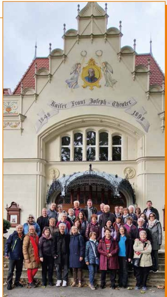
Gruppenfoto vom Chorausflug nach Berndorf

Erste Station am Weg zum Ziel war der Skulpturenpark in Enzersfeld/Lindabrunn. Auf dem etwa 12 ha großen Areal der zwischen 1969 und 1996 geschaffenen Skulpturen entstanden zahlreiche lustige Fotos.