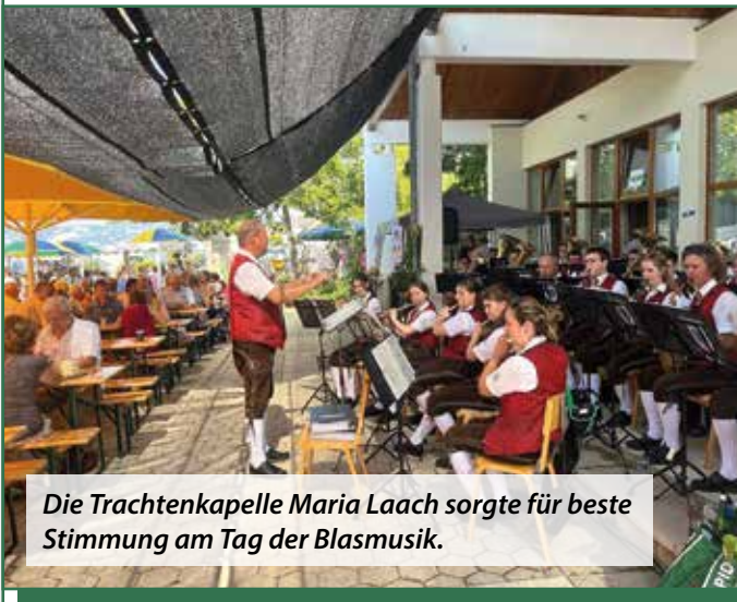
Die Trachtenkapelle Maria Laach sorgte für beste Stimmung am Tag der Blasmusik.

Wir bedanken uns herzlich bei allen Anwesenden!