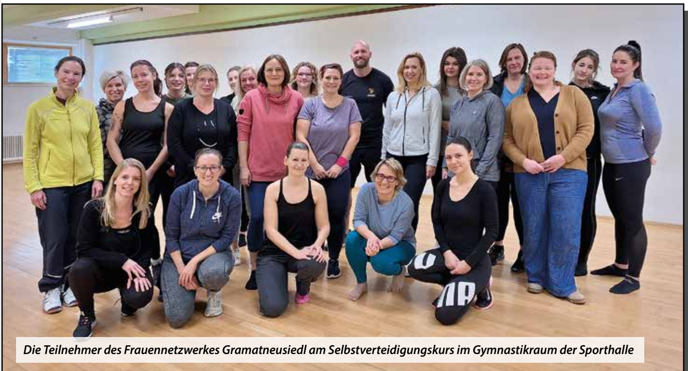
Die Teilnehmer des Frauennetzwerkes Gramatneusiedl am Selbstverteidigungskurs im Gymnastikraum der Sporthalle