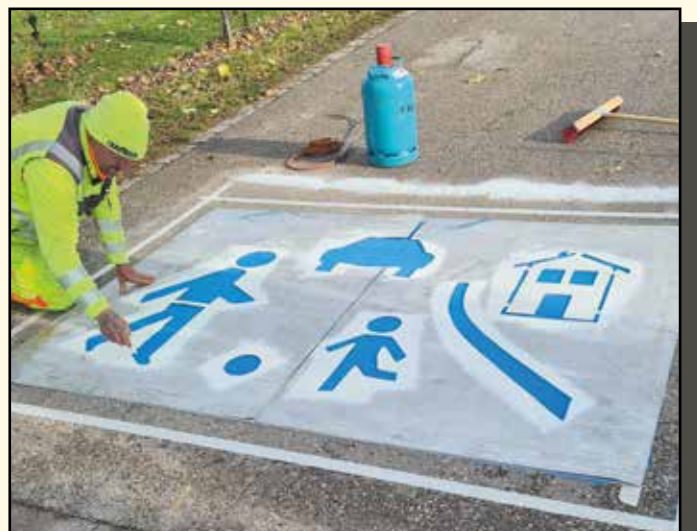
Mit Hilfe einer Schablone kam das Wohnstraßensymbol auf den Asphalt.