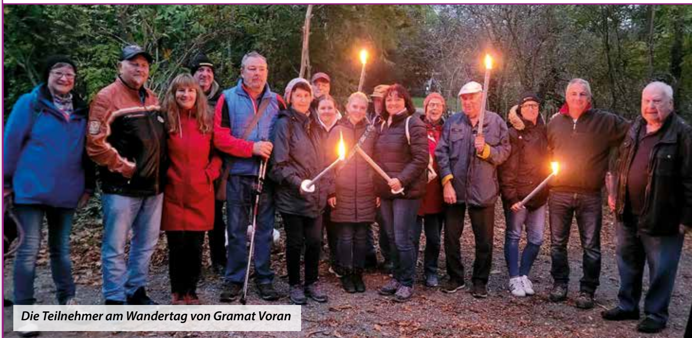
Die Teilnehmer am Wandertag von Gramat Voran

Mit Fackeln wanderte die Gruppe in der Dämmerung retour.