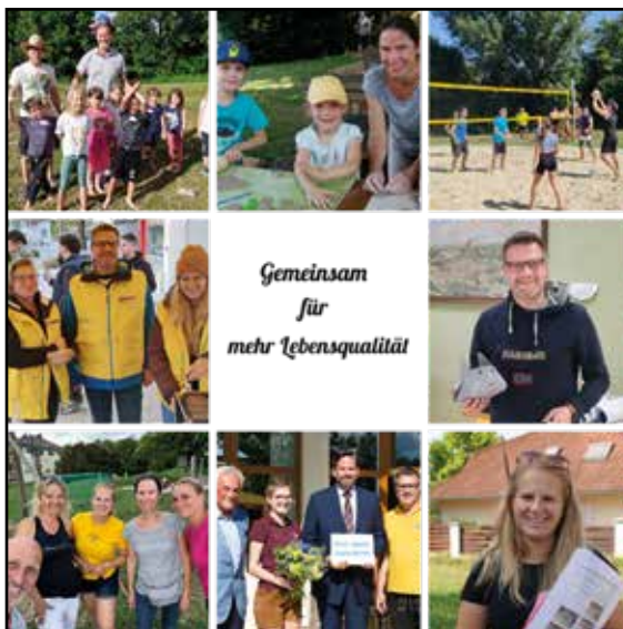
Gemeinsam für mehr Lebensqualität

Mit Osterbasteln , Ferienspiel und einer Nikolo-Aktion konnten wir auch heuer viele Kinder mit einem sehr vielfältigen Programm begeistern.