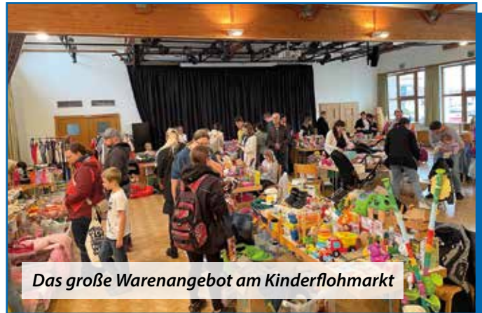
Das große Warenangebot am Kinderflohmarkt