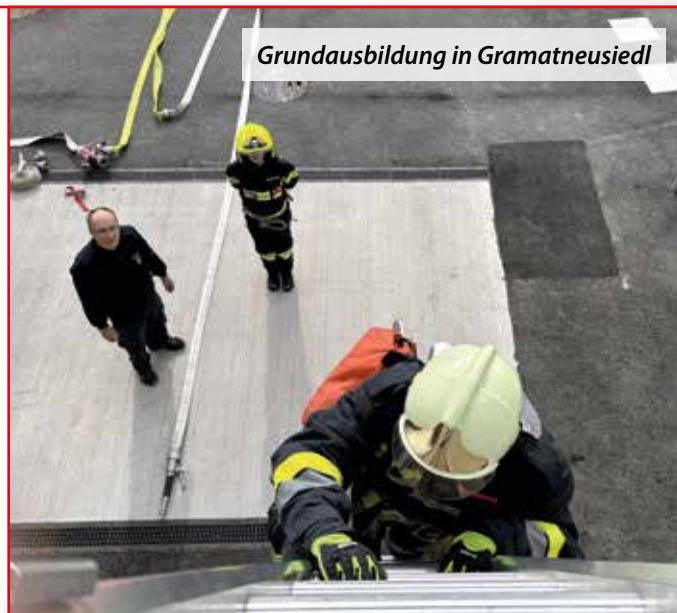
Grundausbildung in Gramatneusiedl

In dieser gasbefeuchten Wärmegewöhnungsanlage werden einsatznahe Zustände wie Hitze und Rauch simuliert, um die Auszubildenden möglichst authentische Einsatzbedingungen bieten zu können. Das Übungsszenarium ist in zwei Blöcken aufgeteilt.