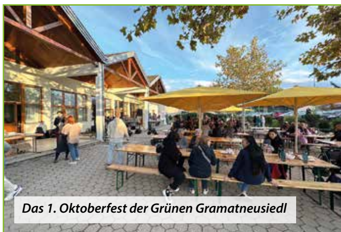
Das 1. Oktoberfest der Grünen Gramatneusiedl