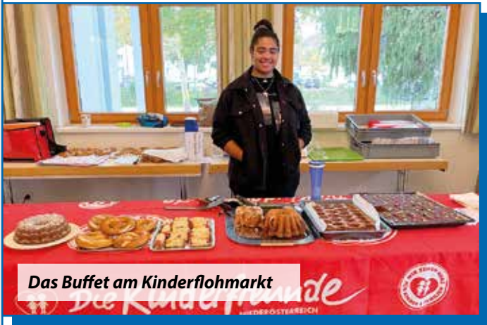
Das Buffet am Kinderflohmarkt