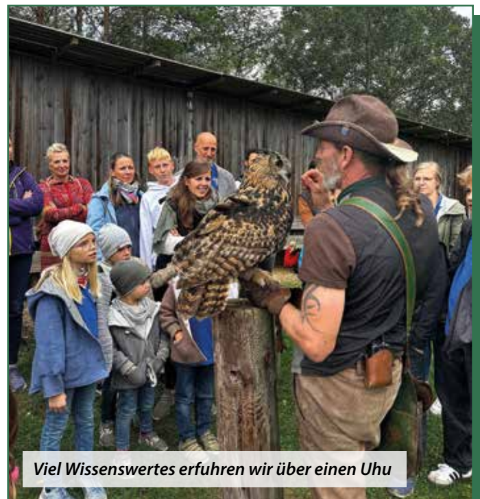
Viel Wissenswertes erfuhren wir über einen Uhu

Schlussendlich trafen wir - zwar mit Verspätung - aber immer noch mit guter Laune beim Ortsheurigen Nowak ein. Poldi verwöhnte uns mit kalten Platten und so ließen wir den Tag noch stimmungsvoll ausklingen.