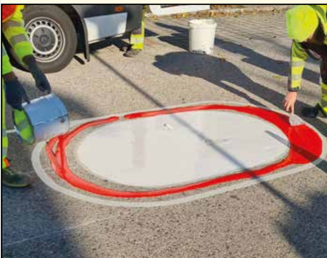
In diesem Bauzustand ist es noch ein Fahrverbots-Symbol, erst mit der Abnahme der Beklebung wurde es zum 30er.

Die Piktogramme sind überall dort platziert, wo von den Landesstraßen kommend in die Gemeindestraßen zugefahren werden kann.