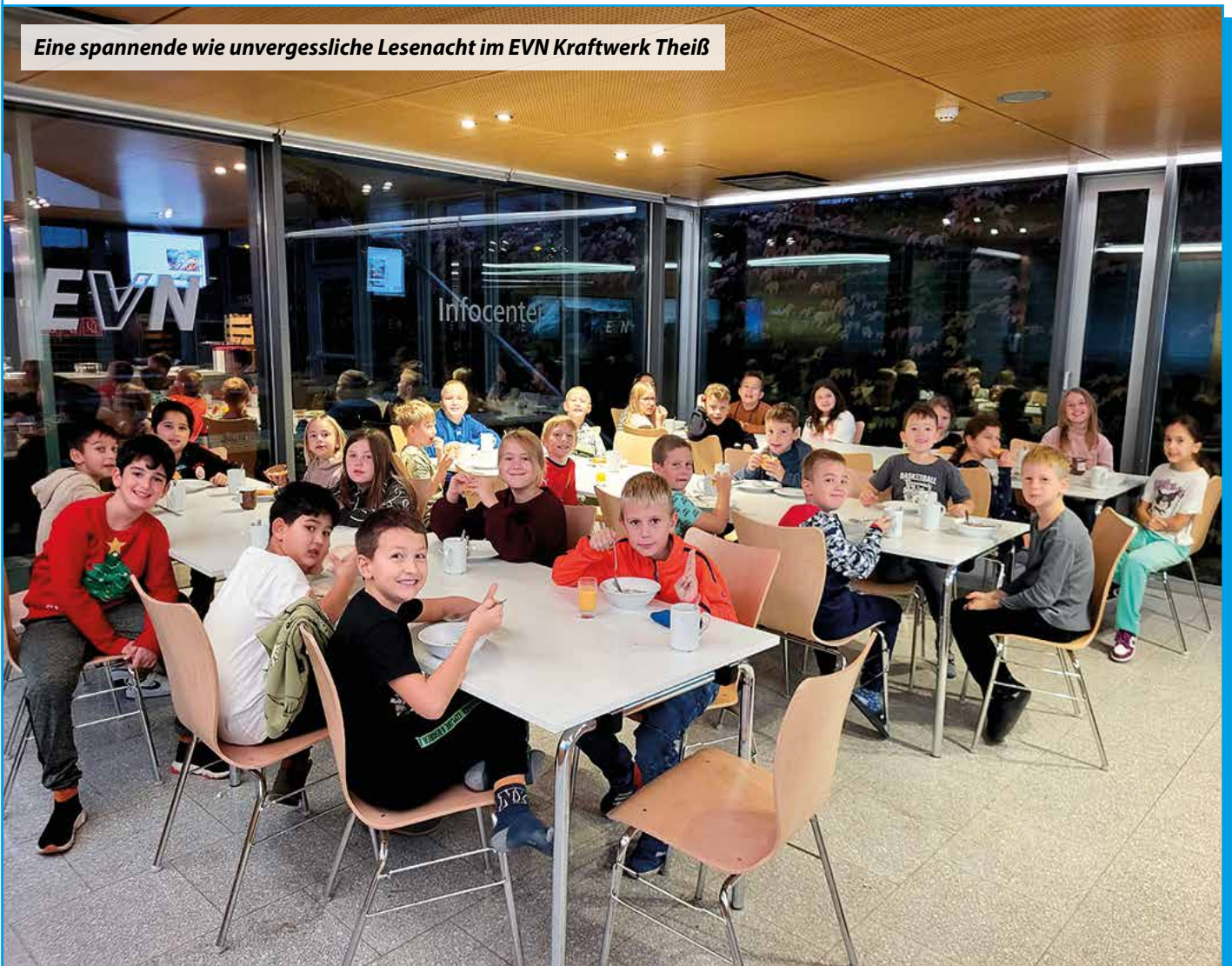
Eine spannende wie unvergessliche Lesenacht im EVN Kraftwerk Theiß

Im Oktober durften die Kinder der dritten Klasse eine ereignisreiche Lesenacht im Kraftwerk Theiß verbringen. Sie erfuhren dabei Vieles über Elektrizität, die Erzeugung von Strom sowie verschiedene Kraftwerkstypen und durften auch eine Nachtwanderung durch das Gelände unternehmen. Natürlich kam das Lesen in den Schlafsäcken, sowie das Tanzen in der Disco nicht zu kurz.