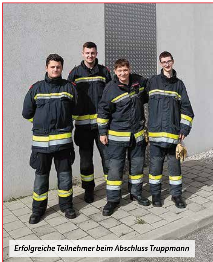
Erfolgreiche Teilnehmer beim Abschluss Truppmann