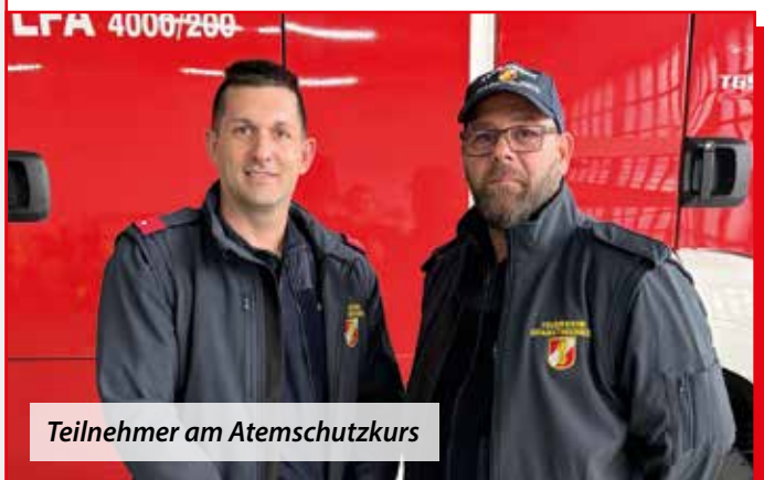
Teilnehmer am Atemschutzkurs

Alle diese Aus- und Weiterbildungen absolvieren unsere Mitglieder, so wie alle anderen Tätigkeiten in Ihrer Freizeit und unentgeltlich.