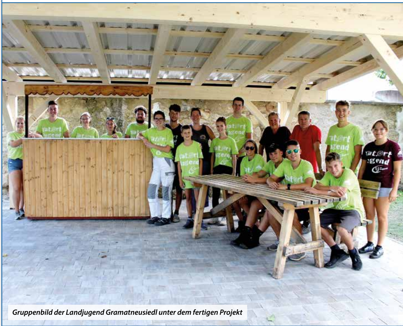
Gruppenbild der Landjugend Gramatneusiedl unter dem fertigen Projekt

Es hat uns wie jedes Jahr sehr viel Spaß gemacht an einem Projekt für die Gemeinde zu Arbeiten.