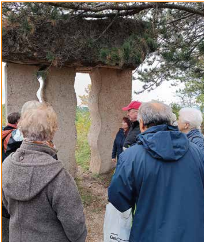
Skulpturenpark in Enzersfeld/Lindabrunn

So ein Chorausflug bietet ausreichend Möglichkeit zum gegenseitigen Austausch und zum Plaudern, denn die Stärkung der sozialen Bindungen im Chor wirkt sich erquickend auf den gemeinsamen Chorgesang aus, was demnächst unter Beweis gestellt wird.