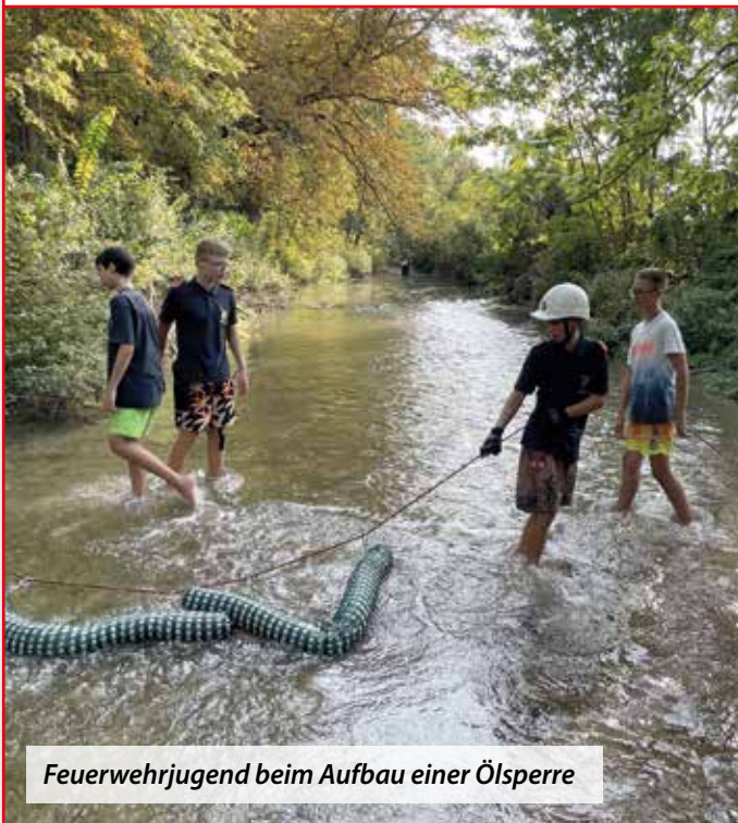
Feuerwehrjugend beim Aufbau einer Ölsperre